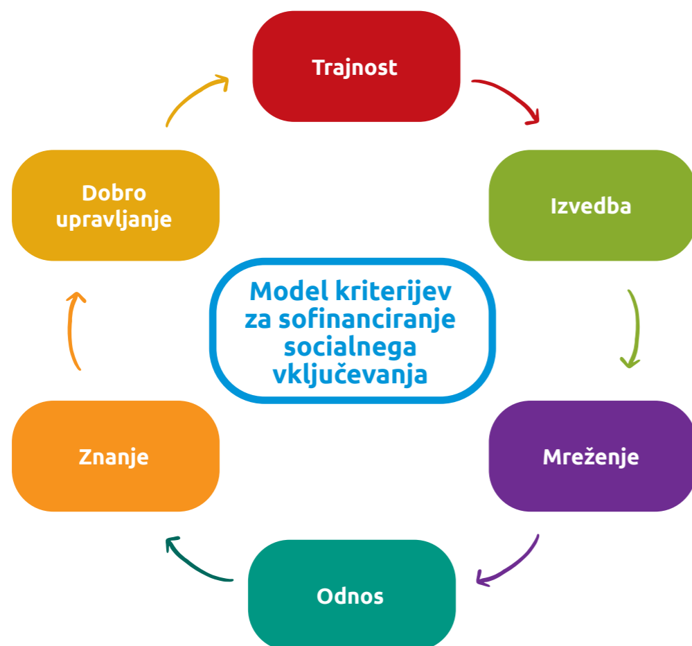
Model kriterijev za sofinanciranje programov socialnega vključevanja v športu

Predlagani model (slika spodaj) si prizadeva omogočiti celovito in trajnostno podporo različnim športnim panogam in organizacijam, pri čemer izboljšuje učinkovitost in enakost sofinanciranja športnih programov.